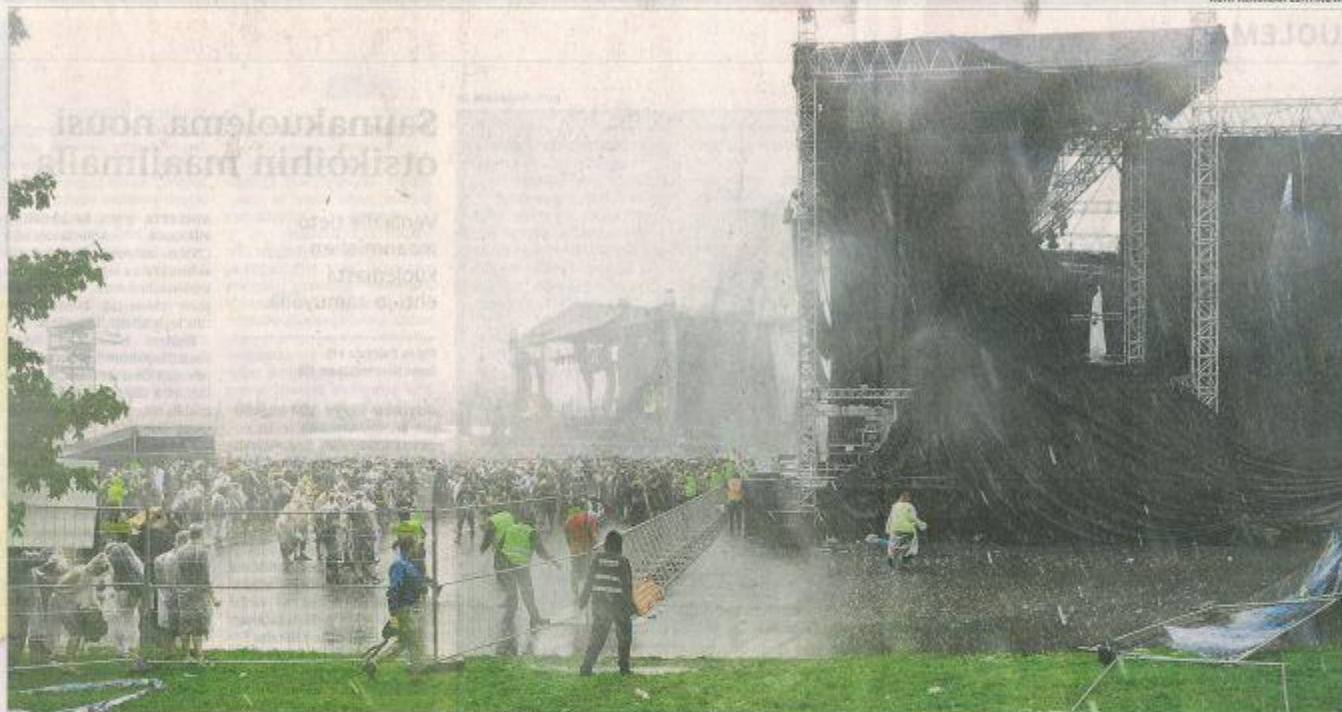
Yllättäen noussut myrsky keskeytti Sonisphere-festivaalin esitykset.